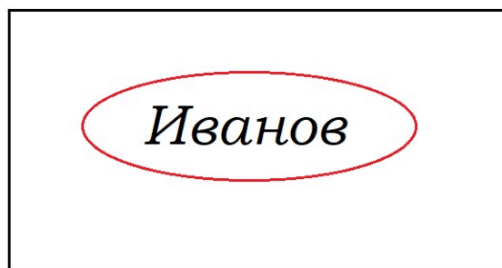
Место для подписи

Примечание: подпись должна: размещаться в центре «места для подписи», иметь четкие, хорошо различимые линии, ставиться черными чернилами, занимать 80% выделенной области и не выходить за пределы рамки.